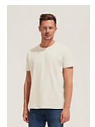
SOL'S Imperial 11500